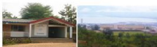
Instituto del Espíritu Santo Gihosha

El colegio del Espíritu Santo fue fundado por los Jesuitas en 1952 en Kiriri. Su primera promoción salió en 1958 con 18 retóricos. Su sede se trasladó a Gihosha en 1983 y se llamó Instituto del Espíritu Santo volviendo a su nombre de origen. En 2007, había 846 alumnos entre los cuales el 54% eran chicas. Desde su creación, se formaron más de 3.400 estudiantes. La Asociación fue creada en 1991 y reconocida legalmente en 2001.